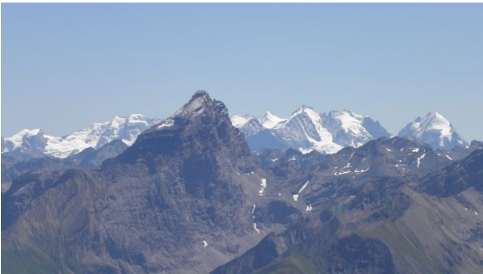
Während in hohen Lagen der Schnee bis auf wenige Reste abschmolz schneite es im Hochgebirge am Montag, 19.08. ein wenig, wie zum Beispiel am Tinzenhorn (3173 m, GR, Vordergrund) oder im Berninagebiet (GR, Hintergrund).