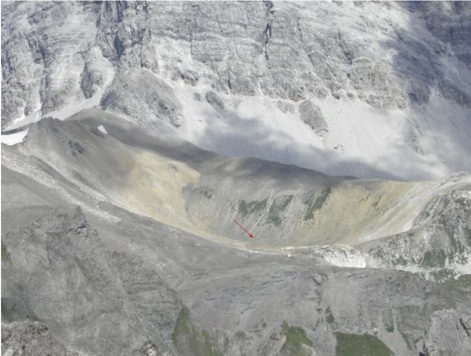
In der Ebene (Pfeil) steht die Schneestation ELA2 (Ela, Tschitta, 2725 m) am Fusse der Fuorcla da Tschitta (GR). Die Auswahl eines Stationsstandortes hängt von vielen Faktoren ab, zum Beispiel dem regionalen oder lokalen Bedürfnis, der Höhenlage, einer genügend grossen und vom Wind wenig beeinflussten Fläche, der Entfernung vom Kamm und der Lawinsicherheit.