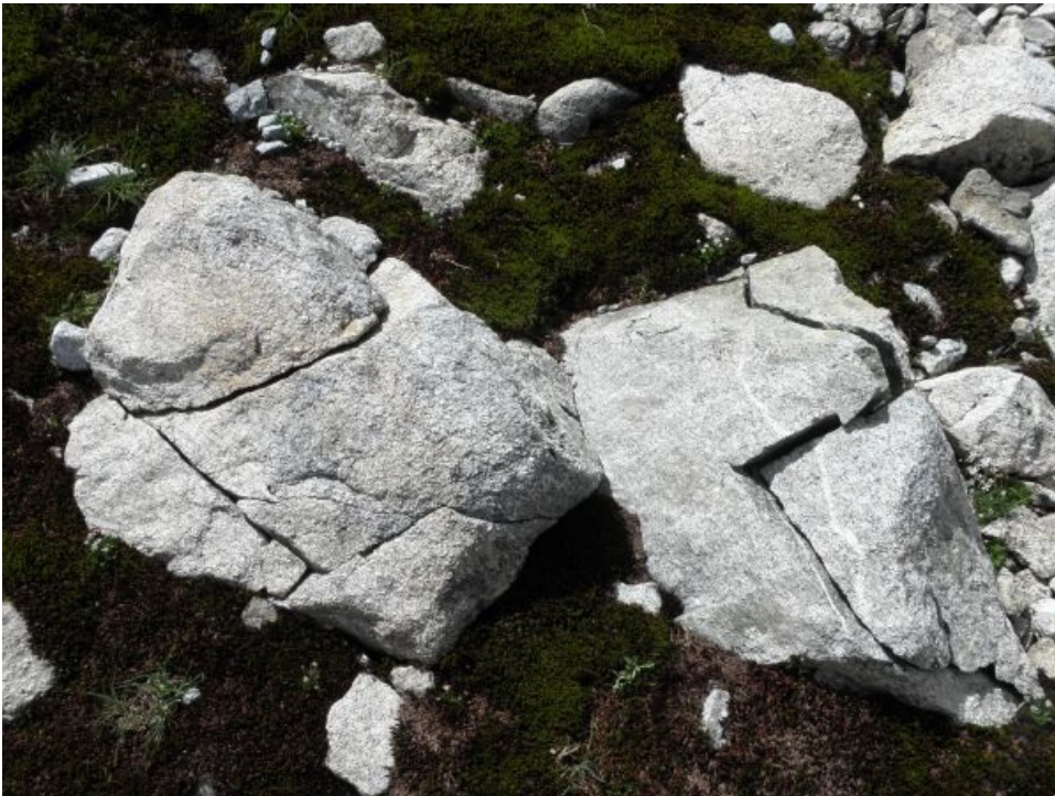
Der Wechsel zwischen Wärme und Kälte sowie gefrierendes und tauendes Wasser setzt dem Gestein zu, sprengt und zerkleinert es.