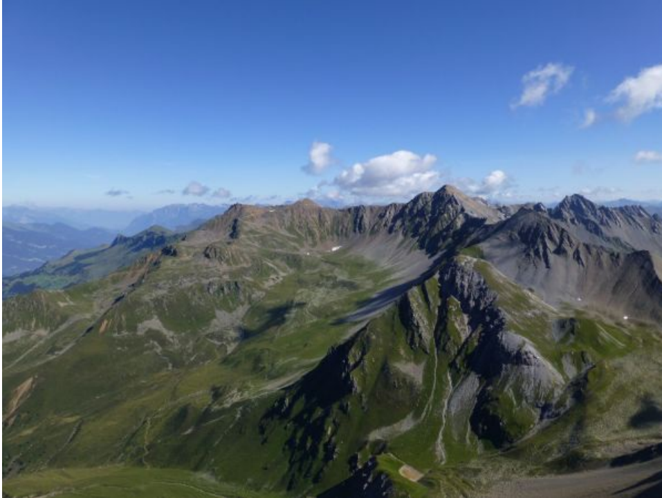
Photo 1: En août, les conditions étaient le plus souvent favorables pour les promenades en montagne et les randonnées en altitude. La photo donne une vue depuis le Lenzer Horn (2906 m, Lantsch/Lenz, GR) en direction du Parpaner Rothorn (2861 m, à gauche) et de l'Arosler Rothorn (2980 m, à droite). Dans la cuvette de la vallée entre les deux « cornes rouges », il y a eu à diverses reprises des accidents d'avalanche, comme par exemple le 06.01.2013.

Beau et chaud. Le mois d'août a été conforme à sa réputation de mois d'été. Les conditions pour les randonnées en altitude étaient généralement favorables. Une seule fois, il a neigé à partir de 2200 m environ. Mais avec les températures douces de la fin du mois, la neige n'a pas pu tenir longtemps.