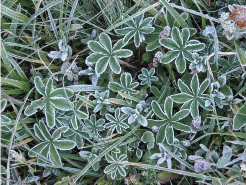
Am Morgen des 21.08.2013 zeigte sich im Landwasser- und Albulatal (GR) zum ersten Mal ein Vorbote des Herbstes - Frost.