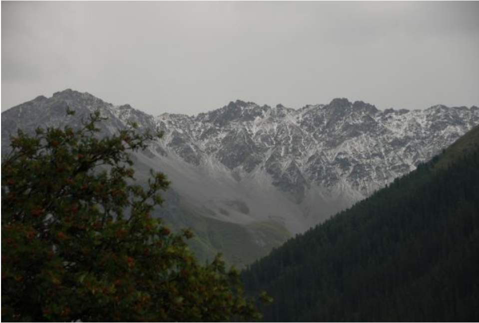
Als sich nach dem Gewitter der Nebel lichtete, lag am Mäschengrat (Monstein, GR) nicht etwa Schnee, sondern Hagel.