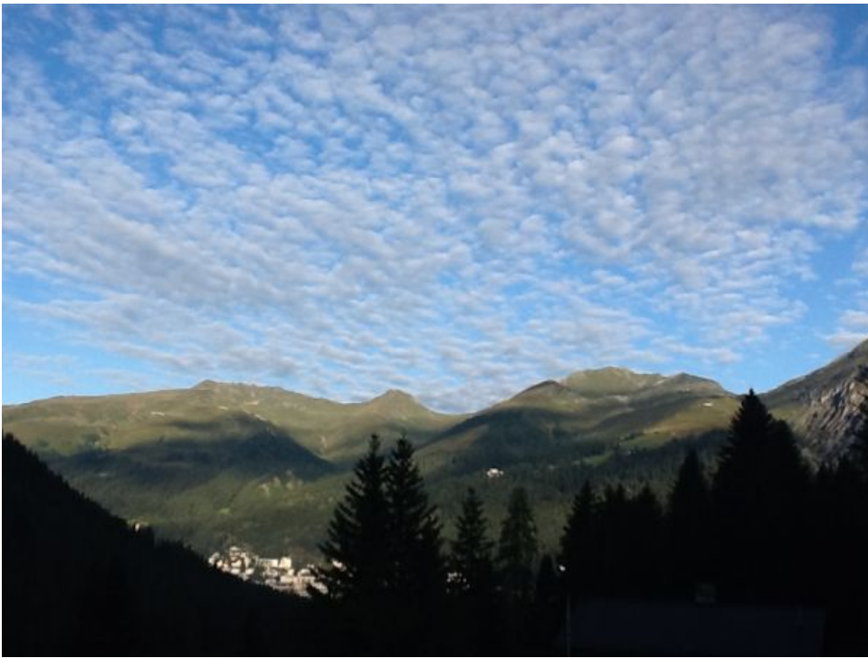
"Der Westen lässt sich immer wieder etwas einfallen", der Blick von In den Büelen (Davos, GR) am Morgen des Donnerstags, 29.08. (Foto: T. Good).