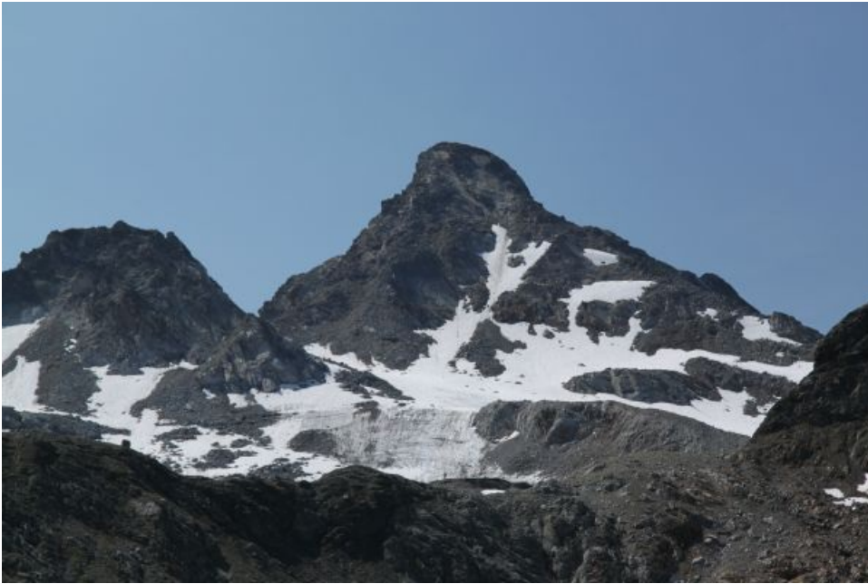
Mitte August war der Jörgletscher auf der Nordseite des Flüela Wisshorn (3085 m, Susch, GR) im unteren Teil aper, nur oben lag noch etwas Schnee.