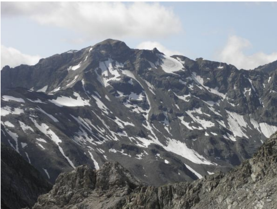
Mitte August lag vor allem in hohen Lagen und im Hochgebirge noch Schnee, in hohen Lagen vor allem in nordseitigen Rinnen und Mulden oder an Hangflüssen mit Lawinenschnee, wie hier am Piz Laviner (3137 m, Tinizong-Rona, GR. 15.08.2013).