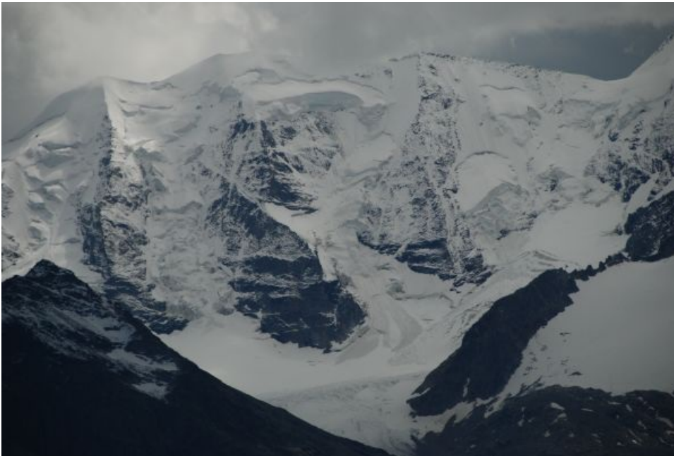
Photo 4: Dans les hautes montagnes de l'Engadine, il a neigé faiblement vers la fin du mois, comme on peut le voir ici aux flèches du Piz Palü (3900 m, Pontresina, GR).

Avec les précipitations intervenues entre le samedi 24 août et le mercredi 28 août, il y avait à nouveau un peu de neige fraîche en haute montagne (cf. photo 4). Les températures douces de la fin du mois (isotherme zéro degré à environ 3500 m) ont cependant fait fondre rapidement cette neige.