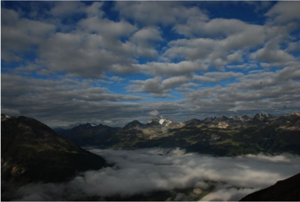
Wunderschöne Herbststimmung im Engadin, hier der Blick vom Schafberg oberhalb von Pontresina (GR) Richtung Piz Lagrev (3165 m, Bivio, GR.).