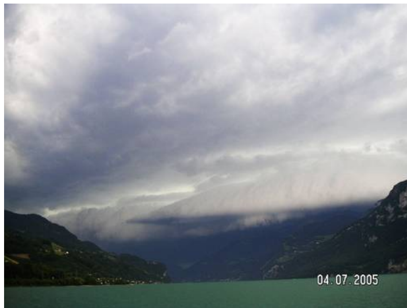
Photo 3: Ligne de grains sur le Walensee. Une ligne de grains est une ligne de nuages se déplaçant rapidement et pouvant se former avant des colonnes d'orages (cumulonimbus). Le passage de la ligne de grains s'accompagne de vents violents soufflant en rafales (parfois même en tempête) et se forme principalement sur les fronts froids, les axes des creux et les orages forts.