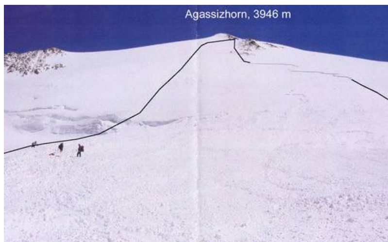
Photo 6: Avalanche de plaque de neige au Agassizhorn (BE) qui a touché 11 personnes. Quatre personnes ont été blessées, altitude environ 3900 m, exposition SSO, épaisseur de rupture environ 20 cm, déclivité environ 45°.

Jusqu'au 11 juillet, le temps est resté variable et frais. A chaque fois, il y a eu un peu de neige fraîche en haute montagne l'après-midi. Les conditions y étaient parfois hivernales. Sur l'Agassizhorn, à 3946 m, dans l'Oberland bernois, 11 personnes ont eu de la chance. Au cours de leur montée sur le flanc raide vers le sommet, les alpinistes de tête ont provoqué le décrochement d'une plaque de neige. Au total 11 personnes qui grimpaient l'une derrière l'autre ont été touchées par le glissement. Heureusement, elles étaient toutes sécurisées par une broche à glace. Quatre personnes ont été blessées par la masse de neige et ont nécessité l'aide de la REGA.