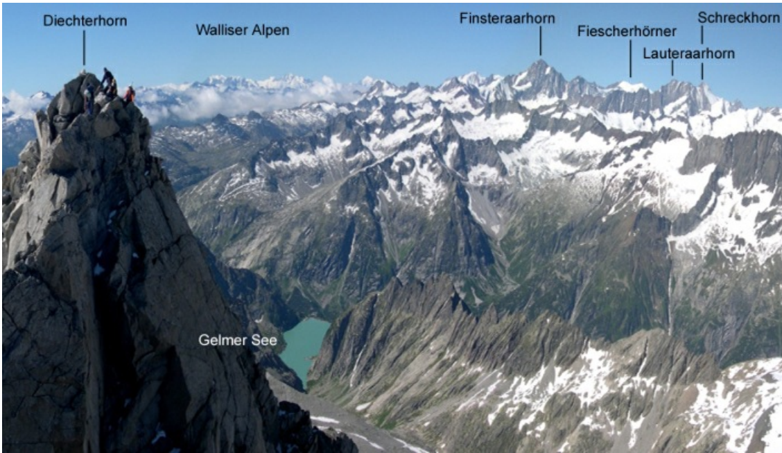
Blick vom Diechterhorn im Triftgebiet, BE in die Walliser und Berner Alpen. Die Schneegrenze lag Anfangs Juli bei rund 2400 m (, 03.07.2005).