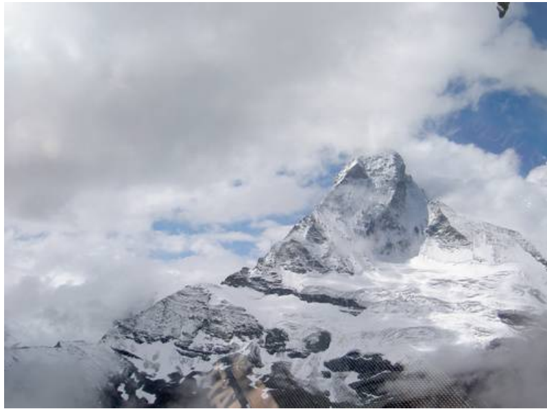
Photo 1: La façade nord du Cervin fraîchement enneigée, le 11.07.2005. Bien que cette vue soit très belle, le danger était grand pour les alpinistes en haute montagne. Plusieurs avalanches se sont produites au cours de cette phase.