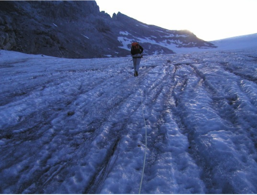
Blankeis im unteren Teil des Glärnischfirns, GL auf rund 2500 m.