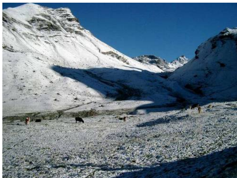
Photo 5: Vaches qui paissent au col de Julier, 2284 m. L'herbe est recouverte de neige le matin du 07.07.2005.

Le 06 juillet, il y avait à nouveau des précipitations avec une limite des chutes de neige à environ 2500 m.