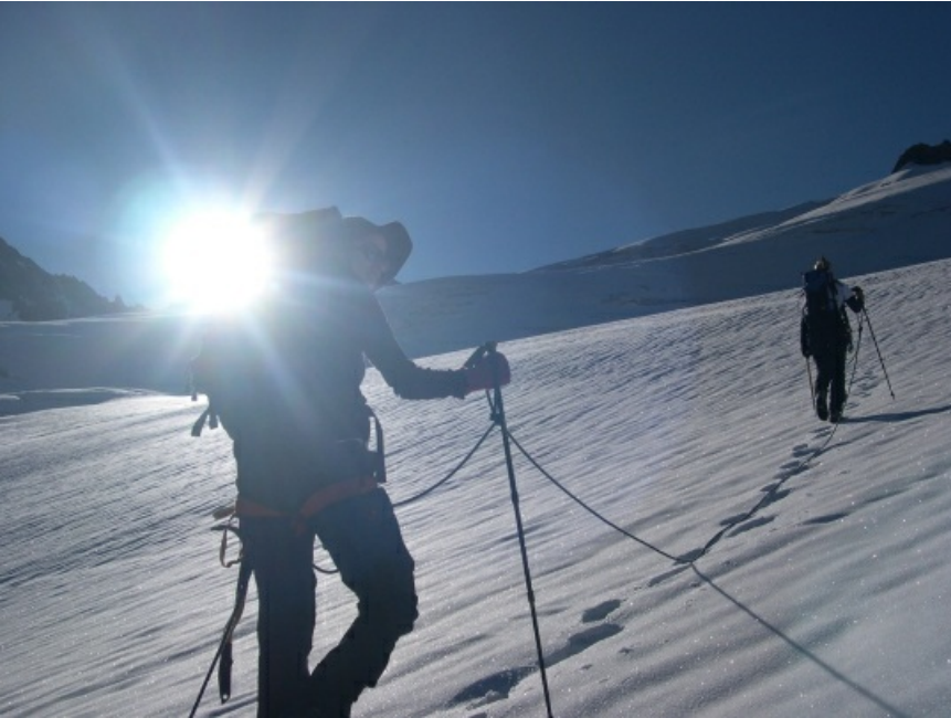
Idealer Trittfirn nach einer klaren Nacht weichte im Tagesverlauf zu schönstem Sulzschnee auf. Leider waren keine Skier zur Hand. Trittgletscher, BE.