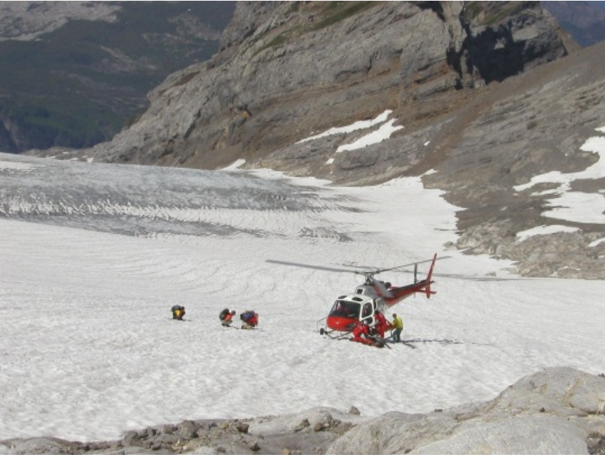
Anseilen auf dem tückischen Glärnischfirn wäre angebracht gewesen. Glück hatte diese Person, welche unangeseilt 4 m tief in eine Spalte fiel und mit dem Helikopter unterkühlt geborgen werden konnte.