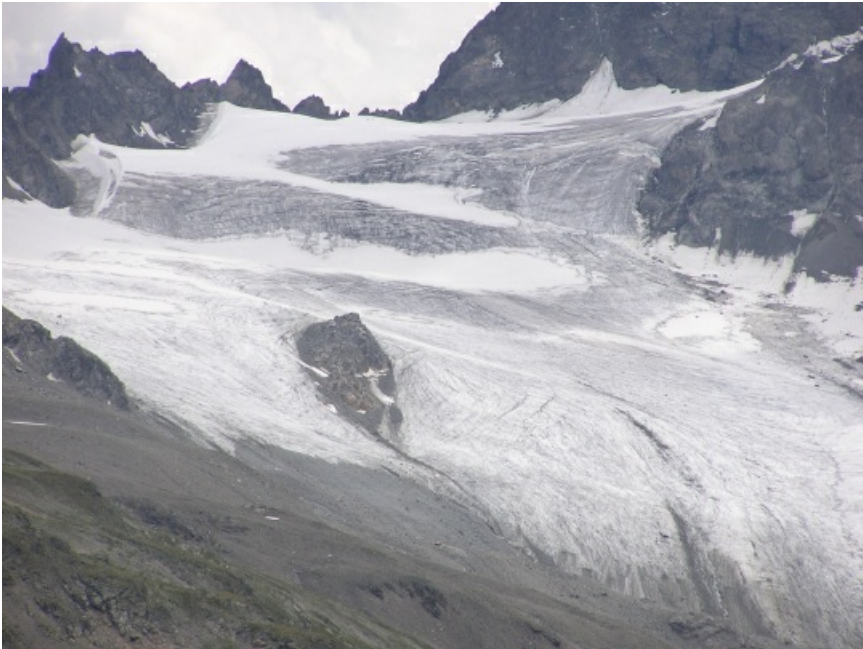
Vadret da Porchabella beim Piz Kesch, GR. Der Gletscher aperte zunehmend aus und der Schnee, welcher noch auf dem Eis lag, war sehr weich. Die Spaltensturzgefahr war gross.