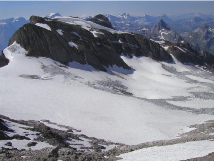
Die Schneebedeckung auf dem Glärnischfirn war nur noch dünn und die Spalten kaum mehr zu erkennen. Ausserdem war der Schnee bereits am frühen Morgen weich.