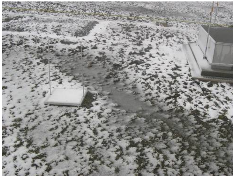
Photo 2: Le 01.07.2005, il a neigé sur le champ de mesure du Weissfluhjoch (GR) à 2540 m. Cette neige était très humide à cette altitude. Au cours de cette phase, les précipitations étaient de 30 à 50 mm sur le versant nord des Alpes et d'environ 20 mm plus au sud. A 3500 m environ, cela correspond respectivement à quelque 30 à 50 cm ou 20 cm de neige fraîche.

La première moitié du mois de juillet était marquée par un temps variable avec des averses et des orages. Dans certains cas, des précipitations persistantes se sont traduites par des conditions hivernales en haute montagne.