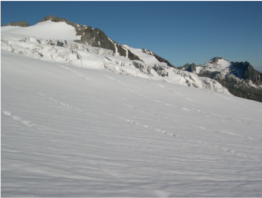
Auf dem Triftgletscher, BE auf rund 2700 m lag nur noch wenig Schnee. Die Spalten waren nur noch mit dünnen Schneebrücken überdeckt.