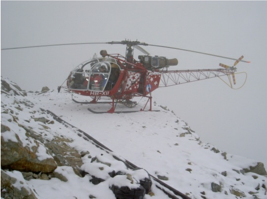
Neuschnee und schwierige Flugbedingungen bei der Rothornhütte, 3198 m oberhalb von Zermatt.