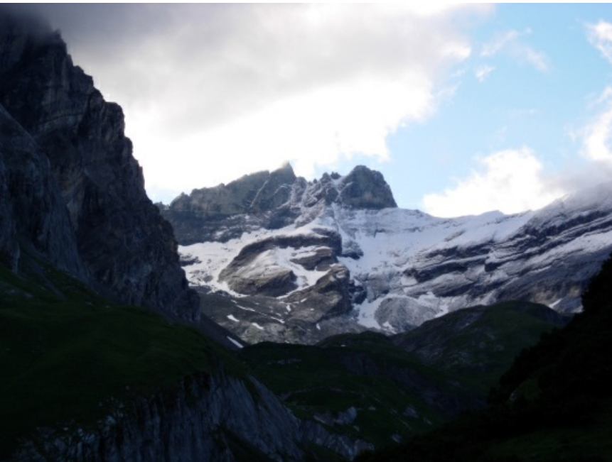
Frisch verschneiter Ringelspitz, 3247 m, SG.