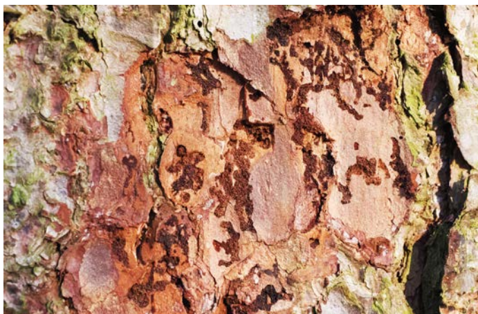
Fig. 4. En haut (A): Galeries de ponte de M. emarginatum . En bas (B): Galeries de ponte du typographe ( Ips typographus ).