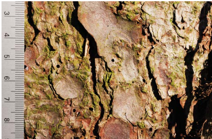
Fig. 3. Orifices d'entrée de M. emarginatum .

cas d'infestation. Si l'on racle la couche supérieure de l'écorce à l'aide d'un couteau, on découvre rapidement laquelle des deux espèces de coléoptères a provoqué les orifices d'entrée. Pour s'assurer qu'il ne s'agit pas d'une attaque mixte, il convient également d'examiner prudemment les sections de tronc concernées à la recherche de galeries (s'arrêter juste avant le cambium).