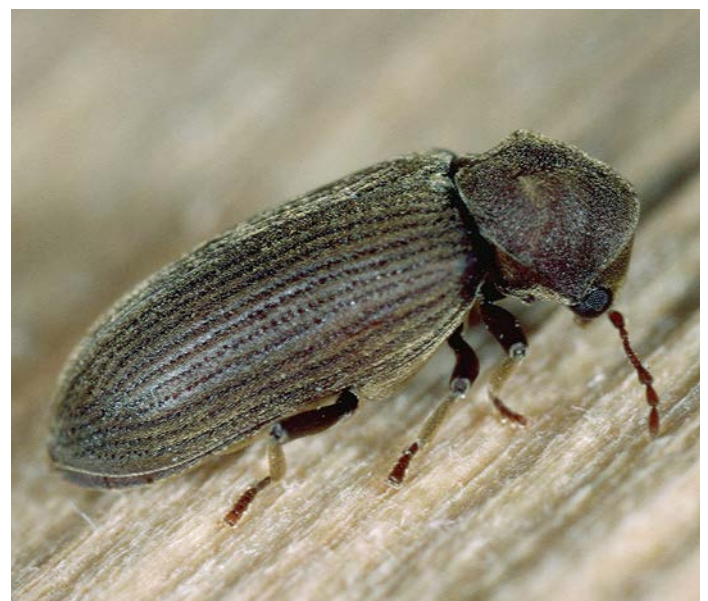
Fig. 2. Vrillette adulte de l'écorce de l'épicéa ( Microbregma emarginatum ).

Outre les projections de sciure et l'écoulement de résine, les décollements d'écaillles d'écorce par les pics et les orifices d'entrée comptent parmi les signes d'infestation les plus fiables d'une infestation récente par le typographe (Kautz et al. , 2022). Toutefois, ces deux derniers symptômes peuvent également être causés par la vrillette de l'écorce de l'épicéa ( Microbregma emarginatum ), un insecte inoffensif (Fig. 2; Triebenbacher et al. , 2017; Pfister, 1994). La caractéristique distinctive est que les orifices d'entrée (Fig. 3) de la vrillette de l'écorce de l'épicéa se terminent par des galeries de forage désordonnées dans l'écorce morte (Fig. 4A), alors que les orifices d'entrée du typographe traversent l'écorce et débouchent sur des galeries mères en forme de fourche dans le liber (Fig. 4B). Comme les galeries d'alimentation la vrillette de l'écorce de l'épicéa se trouvent exclusivement dans l'écorce morte, l'arbre n'est pas endommagé en